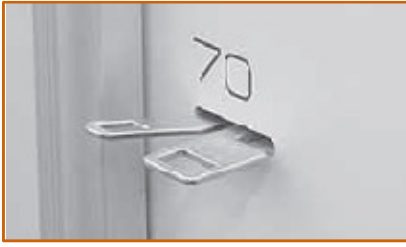
Serratura meccanica Magnetica (MM 140)