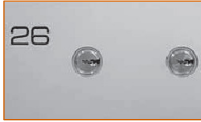
Serratura meccanica a cilindro (SSM 120)