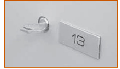
Serratura a cilindro con controllo Elettronico (SSE120)